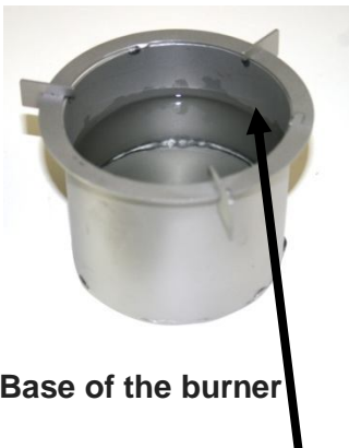
Base of the burner