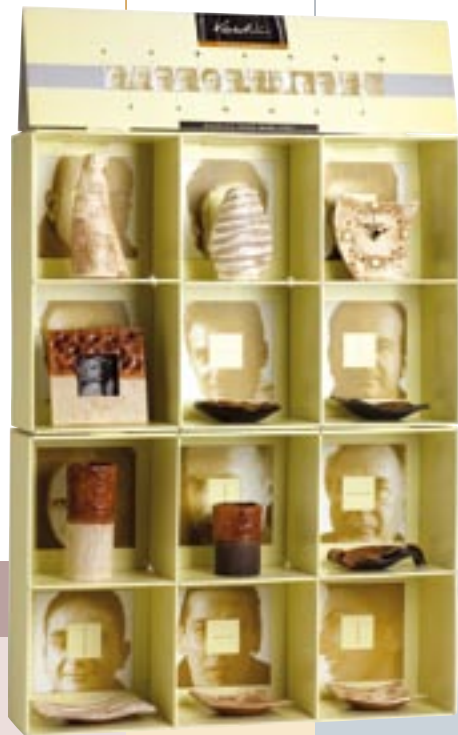
Espositore cm 14x62xh98