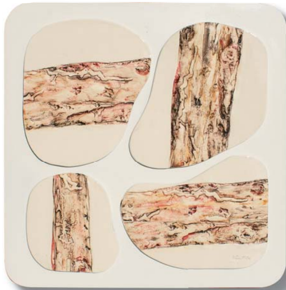
art.: Q-Q2 quadro cm 60 x 60