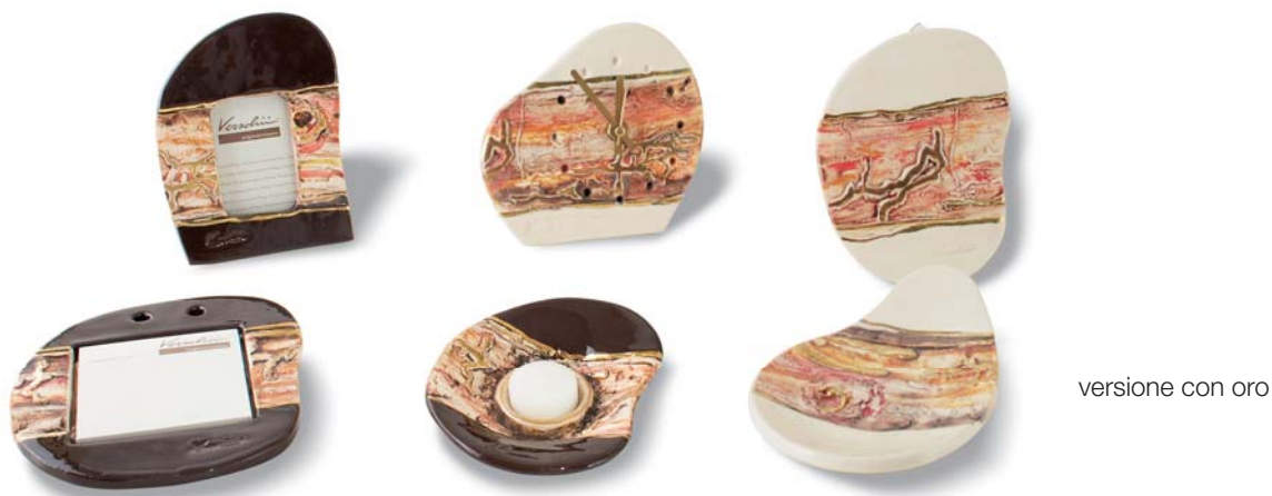
versione con oro