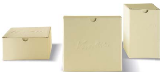
La nostre scatole per bomboniera (Per gli articoli da regalo vengono utilizzate scatole in cartone ondulato color avana)